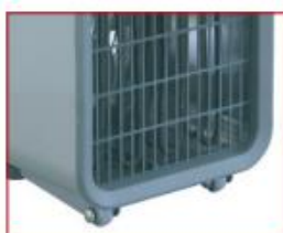
Wieltjes voor het verplaatsen