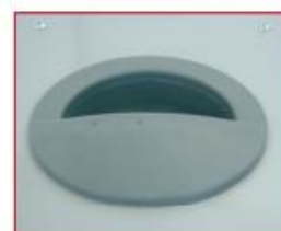
Ergonomisch handvat voor het vervoer

Voor gebruik op werven, in bepleisterde of geschilderde droogzones, serres, fokkerijen, landbouwbedrijven, fabrieken, of bij andere tijdelijke installaties.