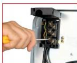
Aansluitingskast eenvoudig te bereiken