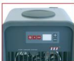
Schakelaar voor het starten, ventilatie en temperatuur