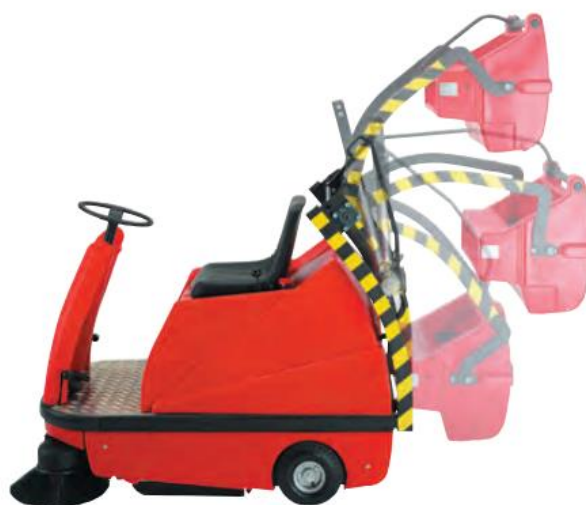
Met optionele hoogdumper

Professionele, batterij aangedreven "ride-on" veeg-zuigmachine. Bedoeld om snel, (ruim 20x sneller dan met de borstel) zonder moeite en stofvrij te vegen in magazijn, productiehal, werkplaats, winkel, showroom, parkeerplaats, terras, oprit, etc..